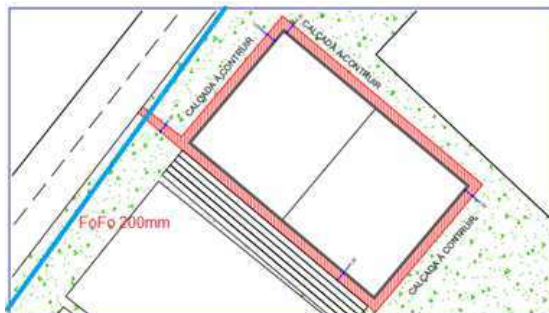
Figura 01 – Interferência identificada

Com relação a interferência com a rede FoFo de 200 mm , a calçada que cruza a referida rede perpendicularmente deverá seguir Informações Técnicas Complementares em sua implantação.