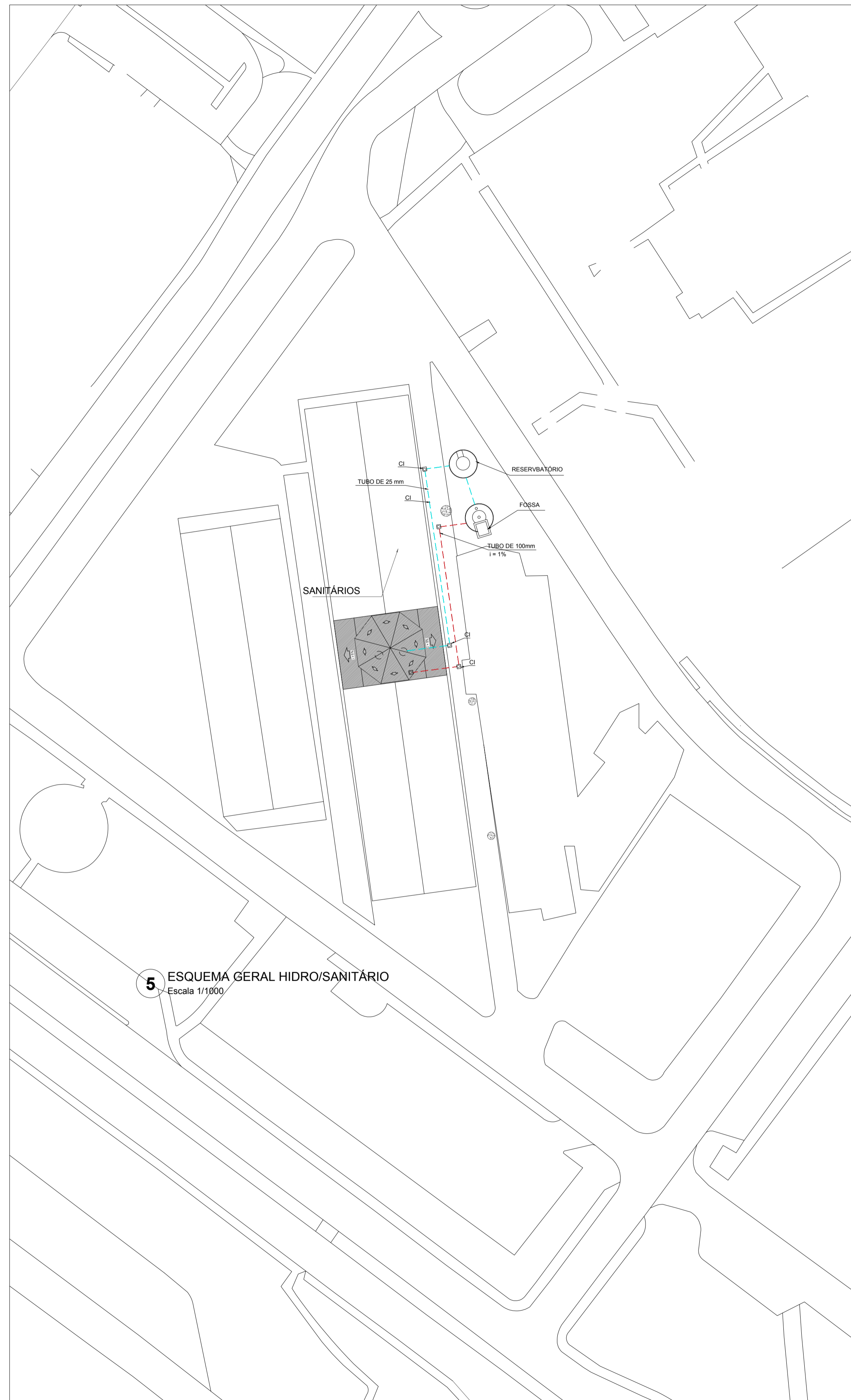
5 ESQUEMA GERAL HIDRO/SANITÁRIO Escala 1/1000